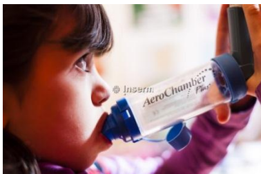
Asthme chez l'enfant