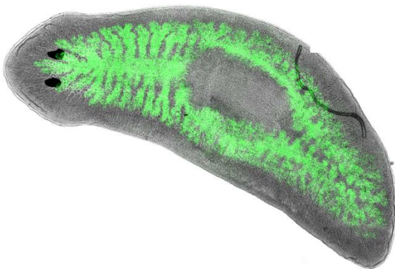
Le planaire Dugesia japonica infecté par des bactéries Legionella pneumophila rendues fluorescentes (en vert, dans les intestins de l'animal).