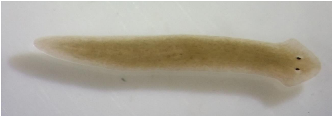
Dugesia japonica , le planaire sur lequel ont travaillé les chercheurs pour cette étude.