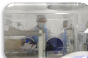
Laboratoire d'études des interactions de l'épithélium intestinal et du système immunitaire