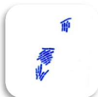
Bactérie Lactobacillus reuteri